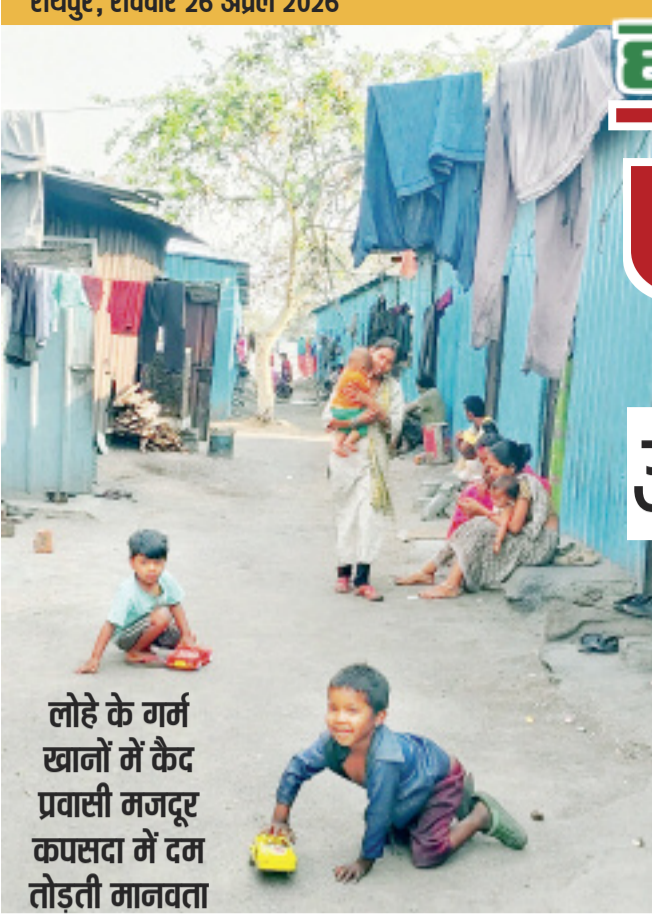
लोहे के गर्म खानों में कैद प्रवासी मजदूर कपसदा में दम तोड़ती मानवता